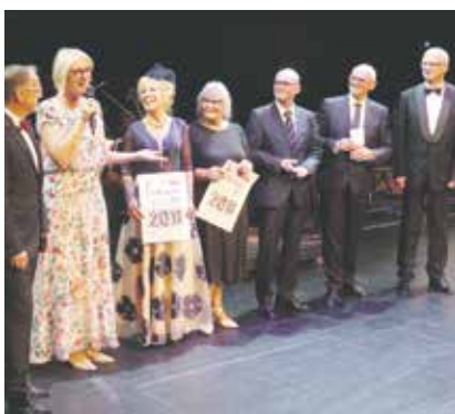
Zum Bautzener Bühnenball wurden die Sponsoren-Urkunden der Initiative feierlich überreicht.

Weitere Informationen zu den Sponsorentiteln und Aktivitäten erhalten Sie beim Bundesverband mittelständische Wirtschaft - Der Mittelstand (BVMW), Geschäftsstelle Bautzen, Tel. 03591/20 09 10, www.buehne.bz