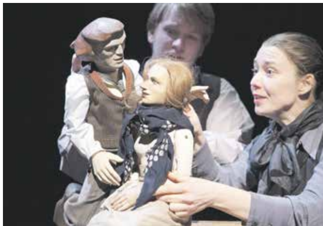
Verschenken Sie vier Theaterkarten fürs große Haus bzw. fürs Burgtheater und noch eine für den 24. Bautzener Theatersommer

Sonderöffnungszeiten der Theaterkasse (Seminarstraße 12) an den Adventssamstagen von 11 bis 18 Uhr (am 24. Dezember ist die Theaterkasse geschlossen) Telefon: 03591/584-225