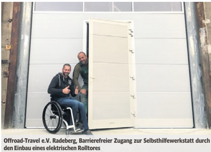
Offroad-Travel e.V. Radeberg, Barrierefreier Zugang zur Selbsthilfwerkstatt durch den Einbau eines elektrischen Rollltores