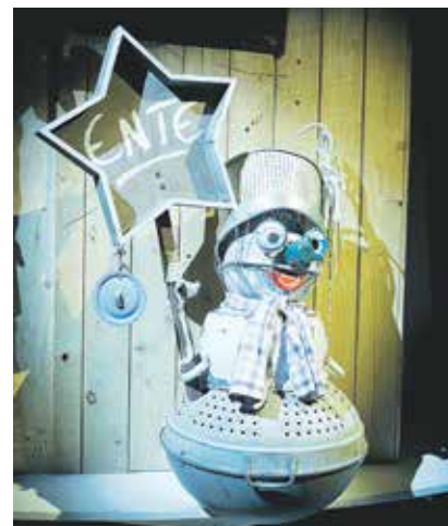
Wie es sich für eine Weihnachtsschmiede gehört, dürfen die Jüngsten ordentlich mithelfen, beim Hämmern und Klopfen.

Die Weihnachtsschmiede im Wald« lädt am 2., 9., 23. und 25. Dezember, jeweils 16 Uhr , Familien zu einem unkonventionellen Puppentheatererlebnis ins