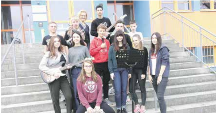
Die Zehntklässler der Bautzener Daimlerschule bereiten ein Musical für den Schüler-Welt-Theatertag 2019 vor.

Daimlerschule feiert am 25. März 2019 Premiere