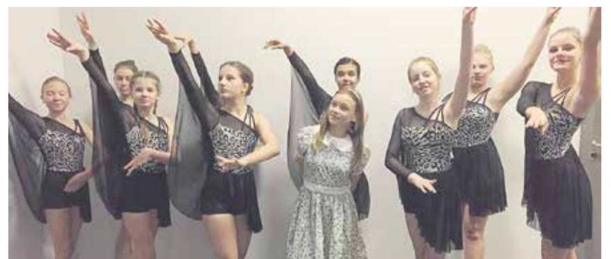
Zwei Mal ist im Dezember das aktuelle Wintertanzmärchen im großen Haus zu erleben.

Reise durch eine kuriose Welt, allerlei Gestalten - von süßen Häschen, über böse Räuber, gefährliche Riesenspinnen, gefährliche Geier, bis hin zur komischen Gesellschaft bei der roten Königin, ist alles dabei. Und sie merkt auch, wie schnell die Zeit vergeht und dass selbst Pflanzen im Irrgarten plötzlich lebendig werden können ... Wie die Reise ausgeht, was Alice alles erlebt und ob sie am Ende wieder zuhause ankommt - das erlebt man in unserer Tanzgeschichte.