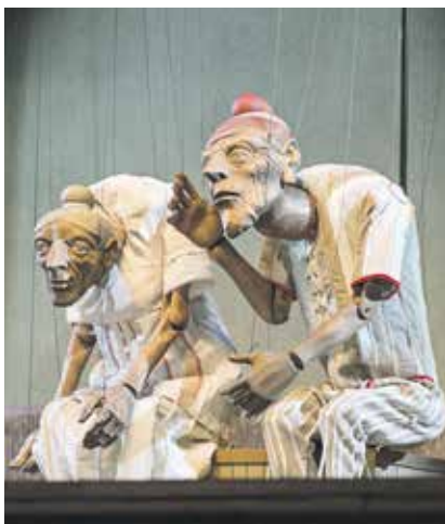
Selten aufgeführt, erstrahlt das Werk im alten Glanz mit dem Ensemble Charpentier, das auf historischen Instrumenten musiziert, einer Barockbühne und großen Marionetten.

Kurz vor Weihnachten, am 22. Dezember, 19.30 Uhr haben Sie zum allerletzten Mal die Gelegenheit in Bautzen, im großen Haus eine außergewöhnliche