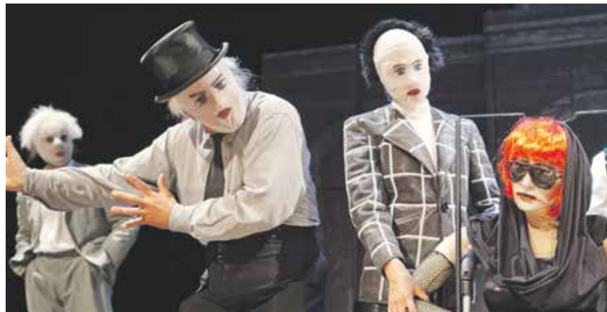
Die »tragische Komödie« von Friedrich Dürrenmatt wird zwei Mal im Dezember zu sehen sein.

det sich gegen Liebe und Menschlichkeit, wählt stattdessen das vermeintlich reiche Leben an der Seite einer Krämerstochter. Doch mit dieser Entscheidung setzt er einen Prozess in Gang, der ihn geradewegs in die Armut treibt. Die Frau, die er auf unmenschliche Weise verstieß, rächt sich, indem sie die Logik des Geldes gegen Alfred wendet: andere sollen ihn ermorden, um selbst reich zu werden.