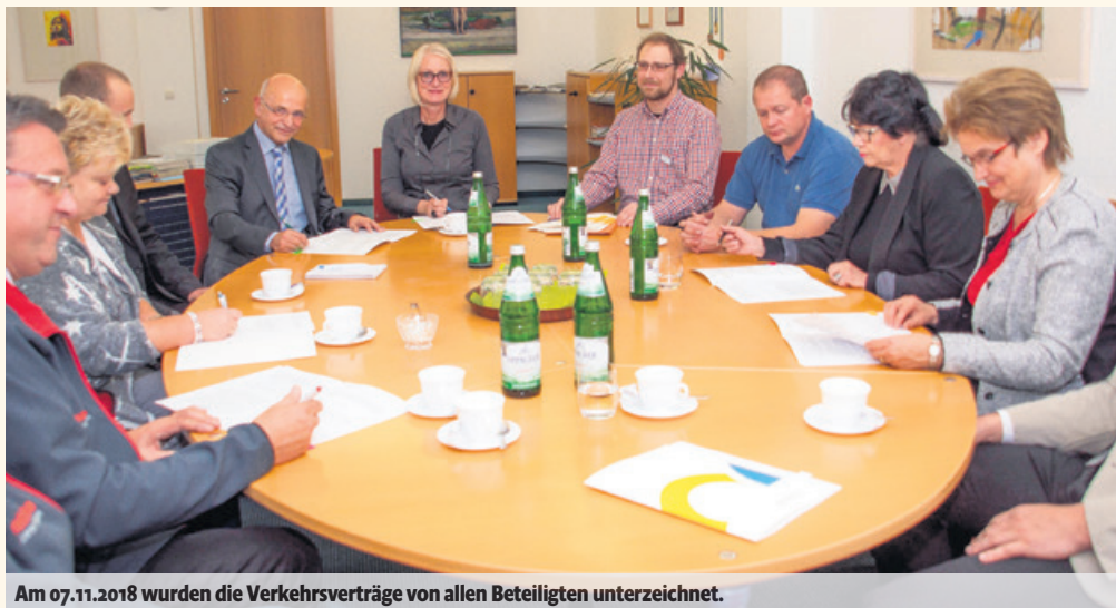
Am 07.11.2018 wurden die Verkehrsverträge von allen Beteiligten unterzeichnet.