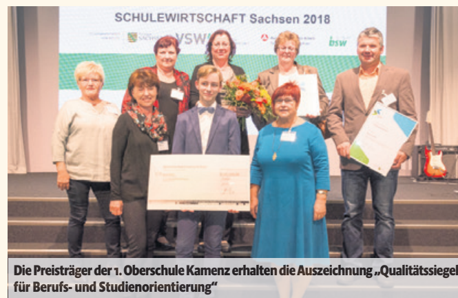
Die Preisträger der 1. Oberschule Kamenz erhalten die Auszeichnung „Qualitätssiegel für Berufs- und Studienorientierung“

Unter den Preisträgern war auch die in Trägerschaft des Landkreises befindliche 1. Oberschule Kamenz. Sie erhielt aus den Händen von Kultusminister Christian Piwarz erneut das Zertifikat „Qualitätssiegel für Berufs- und Studienorientierung“. Neben einer Urkunde und der Siegelplakette erhielt die 1. Oberschule Kamenz erstmals auch eine Prämie von 1.000 Euro. Insgesamt tragen nun 54 Schulen in Sachsen das Zertifikat, das vier Jahre gültig ist. Danach müssen sich die Schulen erneut um eine Zertifizierung bewerben.