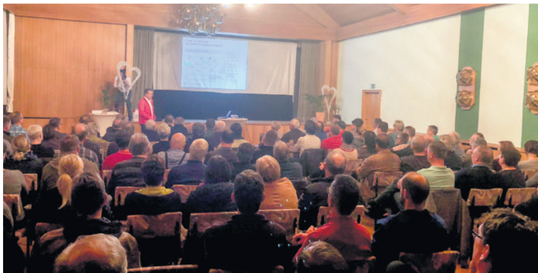
Die Informationsveranstaltung wurde von den Bürgerinnen und Bürger der Gemeinde Radibor sowie die Gemeinden Neschwitz und Puschwitz sehr gut besucht.

Für allgemeine Informationen zum Breitbandausbau im Landkreis Bautzen sowie der Kartendarstellung der zum Ausbau vorgesehenen Gebiete nutzen Sie bitte auch unsere Webseite www.breitband-bautzen.de