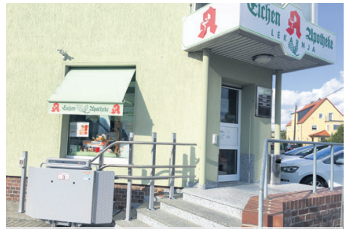
Eichen-Apotheke Großdubrau, Barrierefreier Zugang durch Anbau eines Treppenliftes

E-Mail: lieblingsplaetze@lra-bautzen.de Telefon: 03591 5251-50012 Fax: 03591 5250-50012