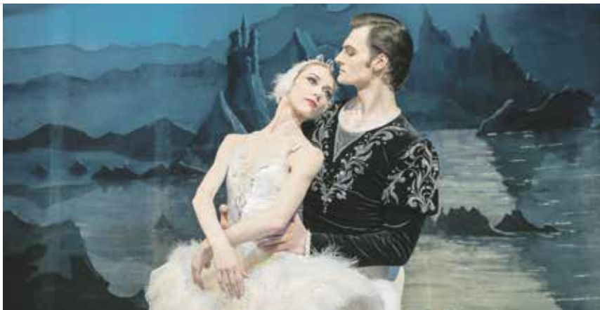
Präsentiert vom Russischen Ballettfestival Moskau werden die beiden Ballettklassiker mit der Musik von P.I. Tschaikowsky Anmut, Grazie und vor allem tänzerische Perfektion auf der Bühne verbreiten.

Das 1877 ist der »Schwanensee« zum ersten Mal gezeigt worden. Es ist das Märchen eines Prinzen, der sich in Odette verliebt, die von dem Zauberer Rotbart in einen weißen Schwan verwandelt wurde. Und diese Liebe wird auf die Probe gestellt: Lyrisches und Tragisches, Festliches und Intimes in dem stimmungsvollen Ambiente der »weißen Bilder« am See im Kontrast zu den prachtvollen und farbenfrohen Kostümen am Königshof, versprechen einen abwechslungsreichen festlichen Abend des großen klassischen Balletts.