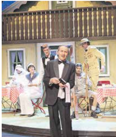
Es herrscht Hochbetrieb im Hotel am Wolfgangsee. Inmitten dieses Chaos entsteht eine unglückliche Liebesgeschichte. Doch wie es sich für ein richtiges Singspiel gehört, findet jeder Topf den richtigen Deckel, den diversen Happy-Ends steht nichts mehr im Weg.

Beim Bautzener Theatersommer 2004 inszenierte Lutz Hillmann diese musikalische Fassung mit großem Erfolg. Nun gibt es eine Neuauflage im großen Haus, mit einem kleinen Spielensemble und Live-Band. Das Regieteam ist nahezu identisch, die Beset-