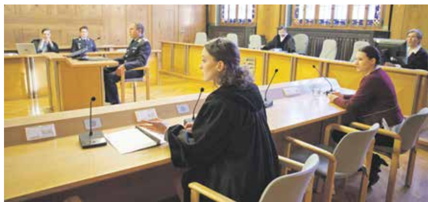
Seien Sie dabei und entscheiden Sie mit im großen Schwurgerichtssaal des Landgerichtes.

Zu erleben am 5. Dezember und 10. Januar, jeweils im Landgericht, Lessingstraße in Bautzen.