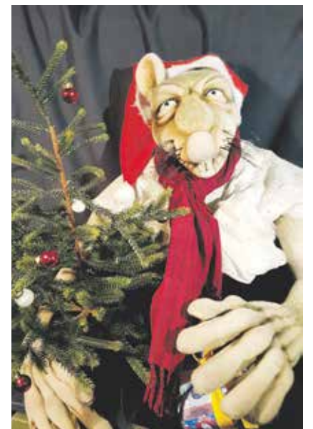
Freuen Sie sich auf eine Bescherung der besonderen Art!