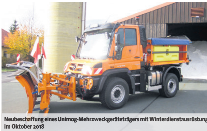
Neubeschaffung eines Unimog-Mehrzweckgeräteträgers mit Winterdienstausrüstung im Oktober 2018

Die Leiter der Straßenmeistereien nutzen zur Planung des Winterdienstesinsatzes täglich aktuelle und auf den Winterdienst abgestellte Informationen des Deutschen Wetterdienstes. Der Winterdienst wird nach einem sogenannten Anforderungsniveau durchgeführt. Dieses gibt vor, welche Straßen zu welcher Zeit geräumt und gestreut werden sollten. Hierzu ist das Straßennetz nach Dringlichkeitsstufen eingeteilt, z. B. wichtige Straßen des