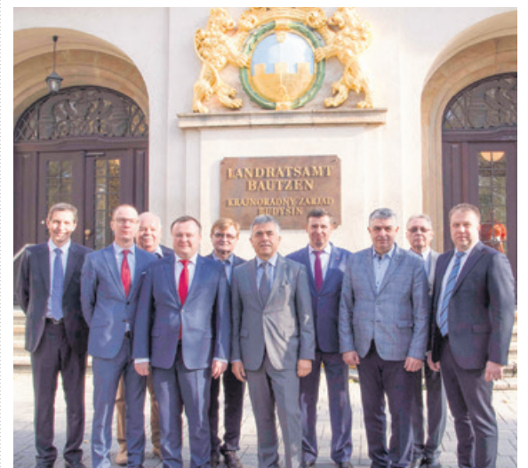
Delegierte aus Minsk besuchten das Landratsamt Bautzen.