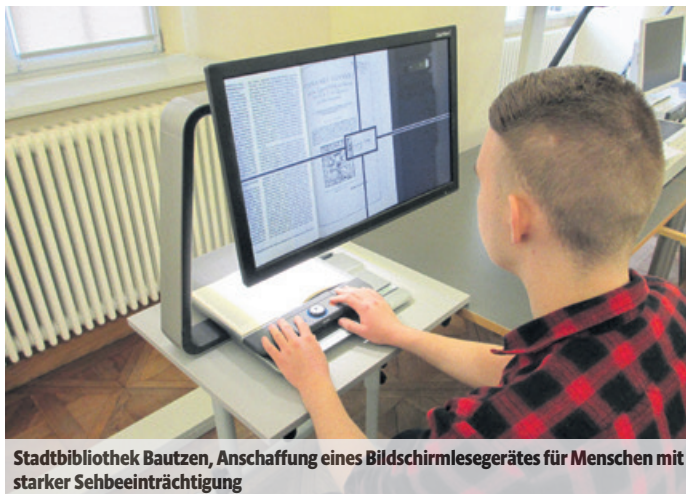
Stadtbibliothek Bautzen, Anschaffung eines Bildschirmlesegerätes für Menschen mit starker Sehbeeinträchtigung

Das Investitionsprogramm zum Barrierefreien Bauen „Lieblingsplätze für alle“ wird aus Fördermitteln des Freistaates Sachsen umgesetzt, welche vom Sächsischen Staatsministerium für So-