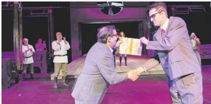
200 Jahre Lausitzer Geschichte sind in spannender Form auf der Bühne zu erleben.