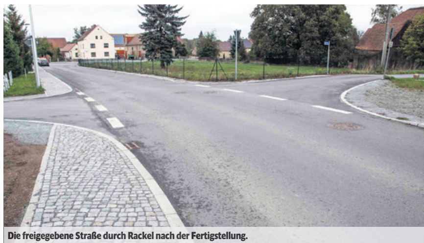
Die freigegebene Straße durch Rackel nach der Fertigstellung.

Besondere Freude trotz herbstlicher Temperaturen kam am 25.10.2018 in der Gemeinde Malschwitz auf. In Rackel wurde die Kreisstraße 7219 durch den Ort feierlich dem Verkehr wieder freigegeben. Landrat Michael Harig bedankte sich gemeinsam mit Bür-