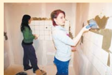
Mädchen üben sich im ÜAZ Bautzen auf der Edisonstraße am Fliesenlegen