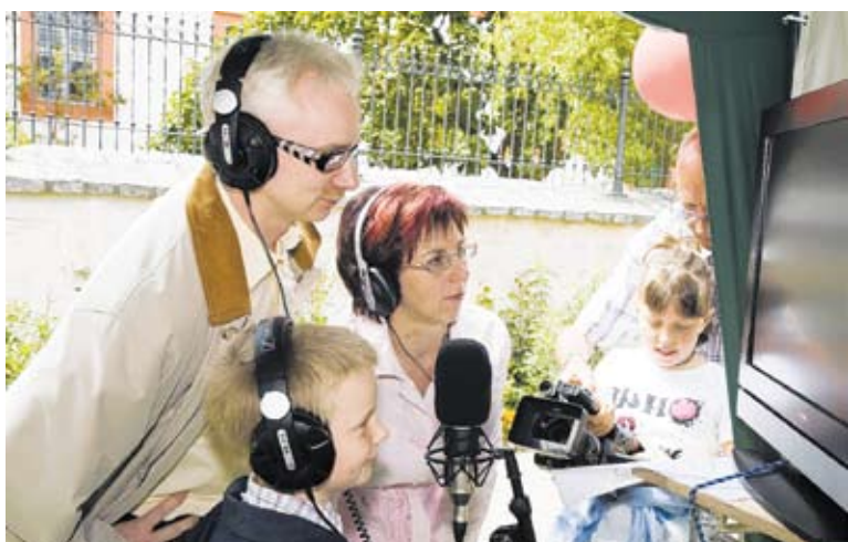
Beim Kloster- und Familienfest 2010 konnte man am Stand der Sächsischen Landesanstalt für privaten Rundfunk und neue Medien und des Sächsischen Ausbildungs- und Erprobungskanals Bautzen mit Hilfe moderner Studiotechnik einen Trickfilm vertonen.