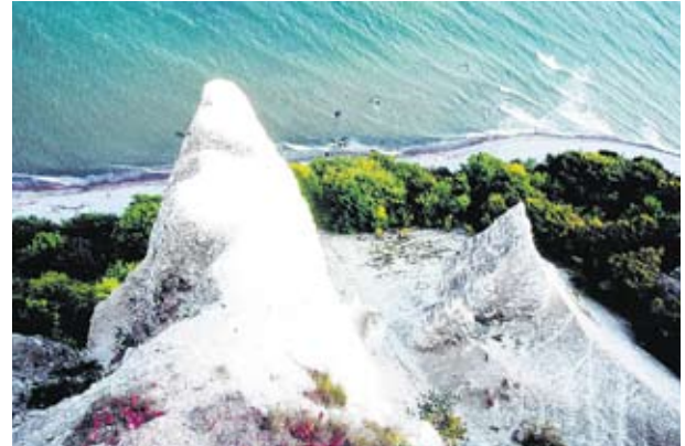
Die berühmten Kreidefelsen im Nationalpark Jasmund.

Hier gibt es Abwechslung in jedem Inselteil - nicht nur an den fast 600 Kilometer langen Küstenabschnitten. Gern besuchen Gäste die Insel in der Vorsaison, um die ersten Sonnenstrahlen und die frische Ostseeeluft zu genießen. Zusammen mit Hiddensee und einigen kleineren Inseln ist der Landkreis Rügen eine der touristischen Hochburgen Mecklenburg-Vorpommerns. Die wichtigsten Ferienorte für den Bade- und Kurtourismus sind Binz, Sellin und Göhren, dazu Sassnitz als staatlich anerkannter Erholungsort. Rügens einzigartige Natur- und Kulturlandschaft zieht zu jeder Jahreszeit Touristen an. Die Insel lässt sich mit dem Fahrrad, zu Fuß oder mit dem