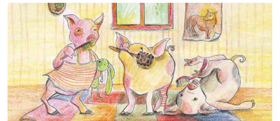
»Ferkel, Hunčo und Prosetko« ist ein Theaterstück mit Klappmaulpuppen für kleine Zuschauer, in dem ganz selbstverständlich drei Sprachen gesprochen werden, nach dem Kinderbuch »Zilli, Billi und Willi« von Elizabeth Shaw.

Unser Puppentheater feiert am Kindertag, dem 1. Juni, 10 Uhr mit »Ferkel, Hunčo und Prosetko« Premiere. Wer Obersorbisch versteht, weiß, dass »Hunčo« Ferkel bedeutet und wer Niedersorbisch versteht, weiß, dass »Prosetko« auch Ferkel heißt. Und so gleich wie die Namen sind, so gleich sind auch unsere drei kleinen Schweinchen. Sie wohnen nebeneinander und kennen sich, sie singen und spielen gern. Aber