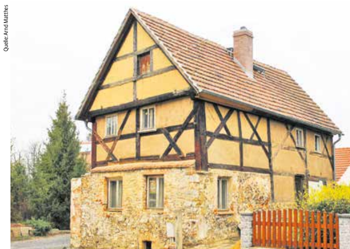
Das Weißenberger Pilgerhaus: Den letzten großen Stadtbrand 1780 in Weißenberg haben nur sehr wenige Häuser überstanden. Dieses wurde nun ein zweites Mal gerettet.

Bald ist es soweit: die Sanierung des Weißenberger Pilgerhauses steht kurz vor der Fertigstellung. 1651, nach dem Dreißigjährigen Krieg wurde es in Weißenberg in der besonderen Ständerbauweise errichtet. Das ehemalige Handwerkerhaus in dem einst Lederhändler lebten, ist ein Schmuckstück geworden. Immer wieder kam bei den Bauarbeiten Neues zum Vorschein. Nun aber sind die letzten Arbeiten im Gange. Holzfußboden, Treppe und der Abwasseranschluss sollen bis zum 6. Mai fertig gestellt sein. Dann kann das Baudenkmal angemessen genutzt werden. Die Schlafräume entsprechen dem Flair des 18. Jahrhunderts, dafür sind Küche und Sanitär modern hergerichtet.