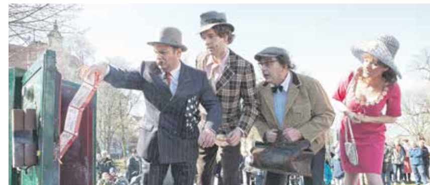
Vom 9. Juni bis 17. Juli steht das Gaunertrio und mit ihnen jede Menge bekannte und neue Gesichter mehr auf der Theatersommer-Bühne im Ortenburghof.

Der Vorverkauf zum diesjährigen Bautzener Theatersommer läuft auf Hochtouren – über 23.000 Karten sind bereits vergeben. Sichern Sie sich rechtzeitig Ihre Karten, denn die Premiere wird schon am 9. Juni im Hof der Ortenburg gefeiert. »Gut geht es den Dänen und denen, denen Dänen nahestehen« sagte Außenminister Steinmeier einmal, Auch wenn dieses Motto erst wesentlich später formuliert wurde, so half doch seit Ende der 1960er Jahre der wahrscheinlich berühmteste Film-Export aus Dänemark dabei, das kleine Land über die Grenzen hinaus bekannt zu machen. Unter dem Markenzeichen »Die Olsenbande« wurden von 1968–1998 insgesamt vierzehn Kriminalkomödien produziert, die besonders hier im Osten Deutschlands Kultstatus erreichten. Noch immer gehö-