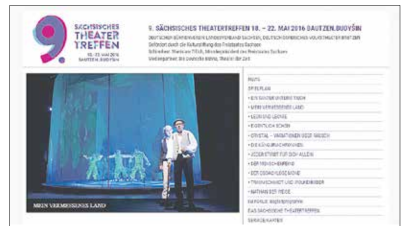
Alles Wissenswertes finden Sie unter »www.saechsisches-theatertreffen.de.«

Jede Menge Fragen rund um das Sächsische Theatertreffen. Doch wir lassen Sie damit nicht im Regen stehen, sondern haben jede Menge Informationen für unsere Besucher zusammengestellt. Eine Übersicht über das gesamte Treffen finden Sie natürlich im Internet auf der Homepage »www.saechsisches-theatertreffen.de/« Oder Sie schauen auf Facebook »9. Sächsisches Theatertreffen« vorbei. Außerdem erhalten Sie im großen Haus und im Burgtheater einen Flyer mit allen Vorstellungen und dem Begleitprogramm zum Treffen. Eintrittskarten für die Vorstellungen des Theatertreffens kosten jeweils 12,00 Euro (ermäßigt 8,00 Euro). Mit einem Festival-Ticket können Sie richtig sparen! Für einmalig 30,00 Euro haben Sie die Möglichkeit, Karten für alle Vorstellungen zu bekommen. Kaufen Sie sich das Ticket und »tauschen« Sie dieses in Eintrittskarten um. Eintrittskarten gibt es an der Theaterkasse, telefonisch oder Sie buchen sich Ihre