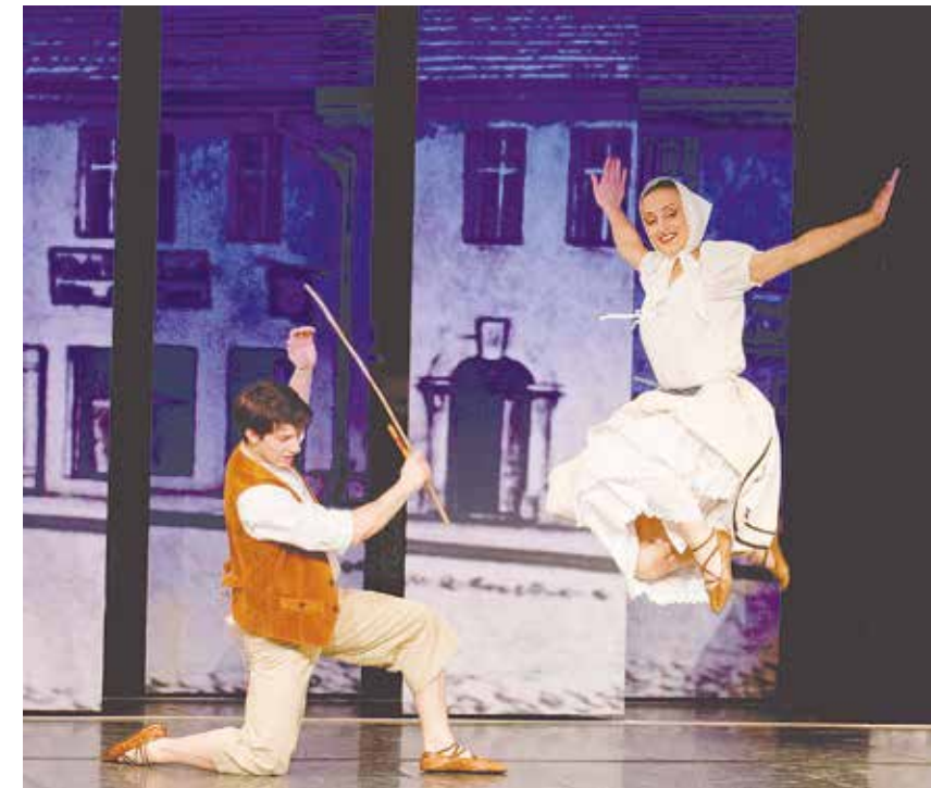
Balet Serbskeho ludoweho ansambla z Husacej reju

W tutej temperamentnej folklornej rewiji Serbskeho ludoweho ansambla pokazuja ludowe narodni hosćo prezentuja z lóštnymi pěsnjemi, kotrež sobu storhnu, swój jónkrótny rukopis a wupěstrěja tak pisany zwukowy přeštrěnc, a to cyle w zmysle serbskeho přisłowa: »Hdyž herc zapiska, zminu so tysač bolosćow!« – Přeswědče so sami!