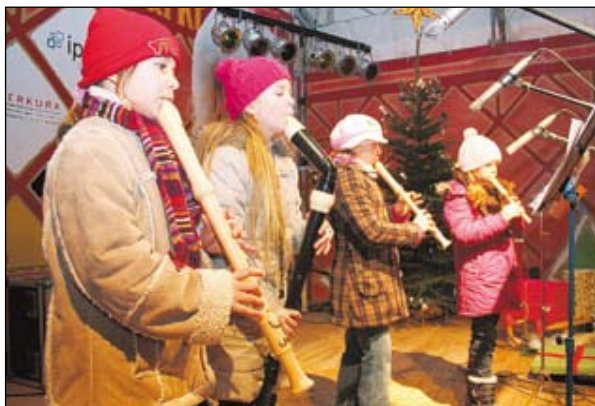
Das Blockflöten-Quartett der Musikschule Kamenz war ein gut besuchter Programmpunkt während des Kamener Weihnachtsmarktes.