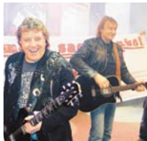
Die Puhdys kommen auch 2010 nach Kamenz.

KAMENZ. Karten für das Puhdys-Konzert auf der Hutbergbühne Kamenz, das auch 2010 traditionsgemäß am Pfingstsonntag, - nächstes Jahr der 22. Mai stattfindet, sind ab sofort in allen CTS-Verkaufsstellen (etwa im WochenKurier) und in Kürze auch in der Kamenz-Information, Pulsnitzer Straße 11, erhältlich. Das teilte Diana Wolfrum vom Kulturbetrieb mit.