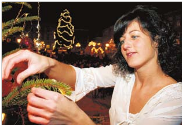
Nachtwäsche & Co.: Heiße Geschenk-Tipps vom Geschäft „hautnah“ wurden am Abend des zweiten Weihnachtsmarkt-Samstag auf der Bühne vorgestellt.