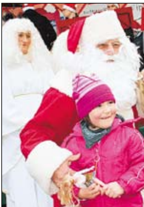
Durfte natürlich auch in Kamenz nicht fehlen: Der gute, alte Weihnachtsmann.