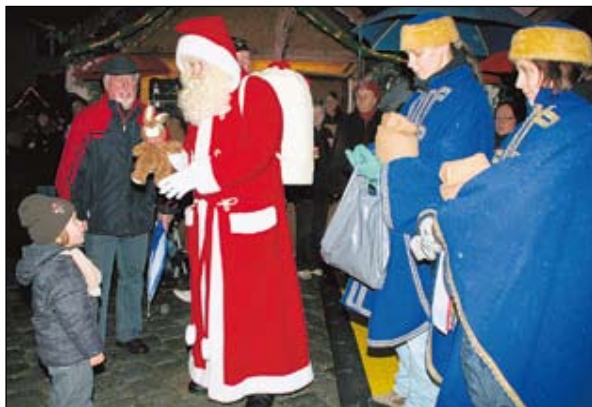
Zu einem Weihnachtsmarkt gehört auch ein Weihnachtsmann - so auch in Hoyerswerda. Er erfreute die vielen kleinen Besucher und machte Lust auf den kommenden Heiligen Abend.