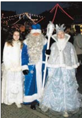
In Eis blauer Farbe präsentierten sich auch viele winterliche Gesellen auf dem Weihnachtsmarkt.

In Hoyerswerda und Kamenz sind sie Geschichte: Hier ein paar Foto-Eindrücke