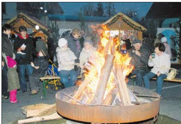
Für angenehme Wärme sorgten in Hoyerswerda nicht nur Glühwein & Co., sondern auch offene Feuer. Viele Besucher nutzten diese wärmende Quelle, um in die Flammen zu blicken und zu entspannen.