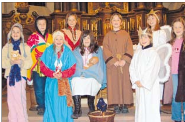
Am Heiligen Abend werden in den Gotteshäusern vielerorts Krippenspiele aufgeführt. Sie erinnern an die Geburt Jesu.